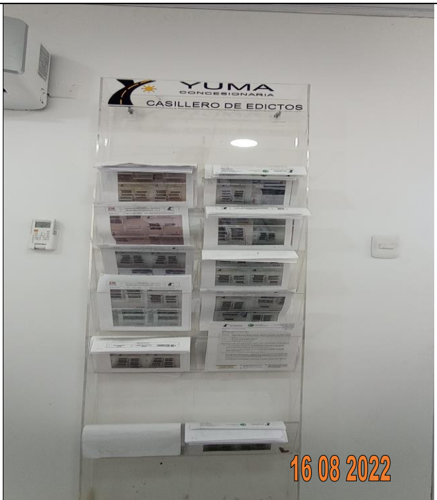
EDICTO R_34006 YC-CRT-117623